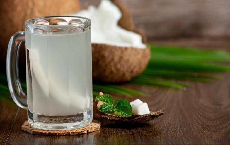
नारळ पाणी अतिशय चवदार आणि आरोग्यदायी आहे. हे उष्णतेपासून आराम