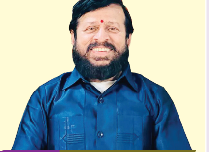
संपादक दिपक मोरेश्वर नाईक