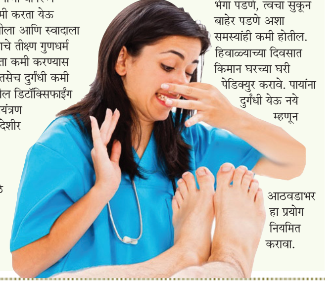
आठवडाभर हा प्रयोग नियमित करावा.

पायाची त्वचा संवेदनशील व नाजूक असल्याने थंडीच्या दिवसात रुक्षता, शुष्कता वाढते. त्यामुळे पायांना नियमित तेलाने मसाज करा. यामुळे पायाला भेगा पडणे, त्वचा सुकून बाहेर पडणे अशा समस्याही कमी होतील. हिवाळ्याच्या दिवसात किमान घरच्या घरी पॅडिक्युर करावे. पायांना दुर्गंधी येऊ नये म्हणून