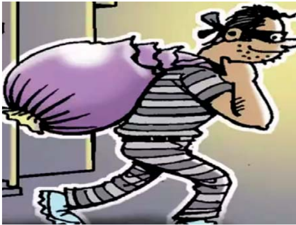
भीती पसरली आहे. टिकावने दरवाजा तोडून साडे सात लाखांचे दागिने लंपास

कोल्हापूर शहरासह जिल्हात चोरी, घरफोड्यांचे सत्र सुरुच आहे. कोल्हापूर शहरातील जगनगरमध्येच चार घरफोड्या झाल्या आहेत. करवीर तालुक्यातील कोपडेंत व्यावसायिकाच्या घराचा दरवाजा टिकावने तोडून साडे सात लाखांचे दागिने लंपास करण्यात आले. इचलकरंजीमध्येही तीन चोरीच्या घटना घडल्या आहेत. त्यामुळे चोरी, दरोडे, घरफोड्यांनी अवघा जिल्हा भयभीत होऊन गेला आहे. जिल्हात गेल्या चार महिन्यांपासून चोरीच्या घटना घडत असल्याने नागरिकांमध्ये