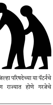
लातूर जिल्हा परिषदेच्या या पट्टेचे अनुकरण राज्यात होणे गरजेचे आहे.

असणार आहे. असा निर्णय घेणारी लातूर ही राज्यातली पहिली जिल्हा परिषद बनली आहे. ज्या आई-वडिलांनी आपल्याला जग दाखवले त्यांना वृद्धापकाळात अनेक जण वृद्धाश्रमात ठेवतात. अनेक जण त्यांच्यासोबत राहात नाहीत. अशी उदाहरण आपण समाजात पाहत असतो. मात्र आता लातूर जिल्हा परिषदेने आपल्या १४ हजार कर्मचाऱ्यांसाठी नवा नियम लागू केला आहे. जे कर्मचारी वृद्ध आई-वडिलांपासून लांब राहात असतील त्यांच्या-त्यांच्या पगारातली ३० टक्के रक्कम कपात करण्याचा निर्णय घेण्यात आला आहे. ही रक्कम वृद्ध मातापित्यांच्या खात्यामध्ये जमा होईल. या निर्णयाचे कर्मचारी आणि त्यांच्या मातापित्यांनीही स्वागत केले आहे.नेहमीच आपल्या विविध उत्तम उदाहरणमुळे चर्चेत राहणाऱ्या